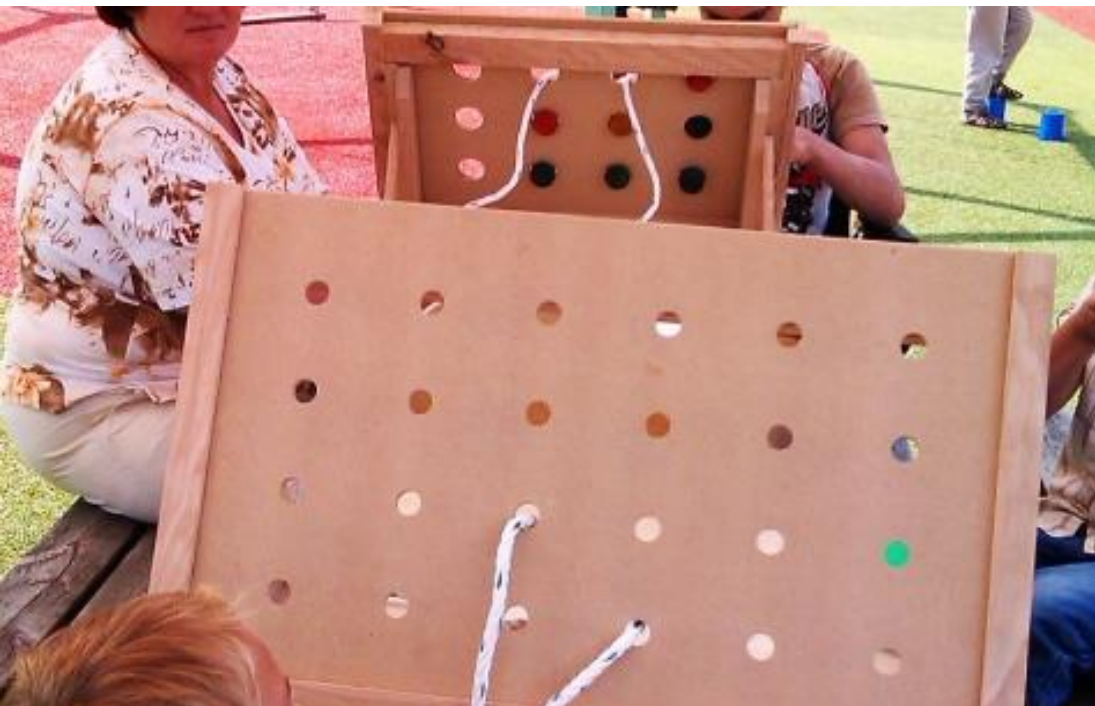
Jocuri adaptate pentru ocuparea timpului liber.