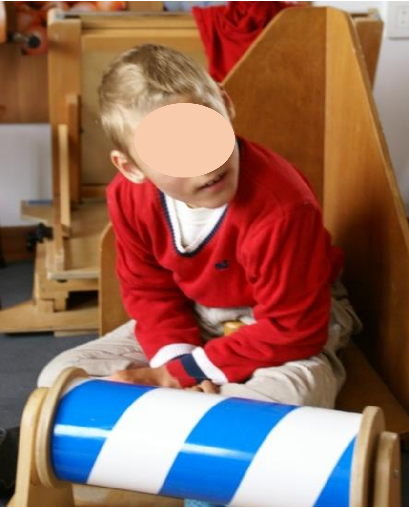
Scaun triunghiular din lemn care oferă suport la jocul pe podea.